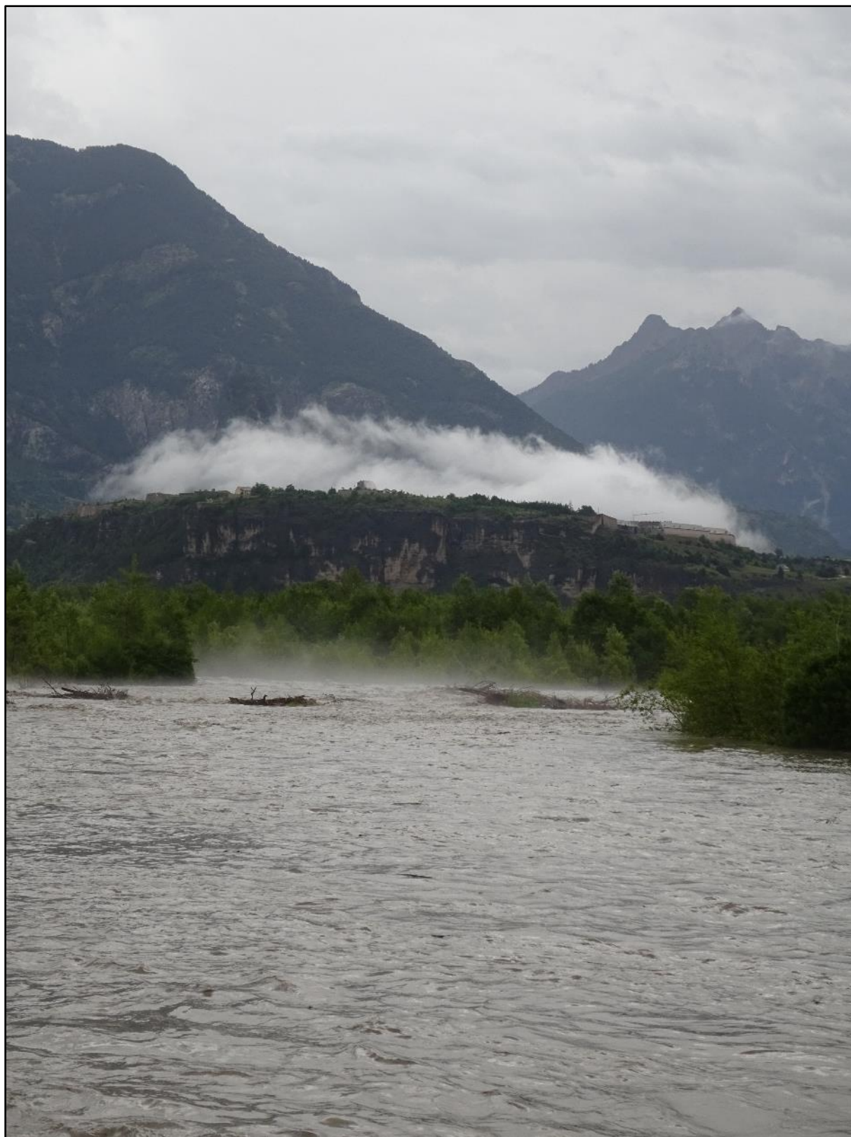
La Durançon avec la formation de brume et le rocher de Mont-Dauphin.