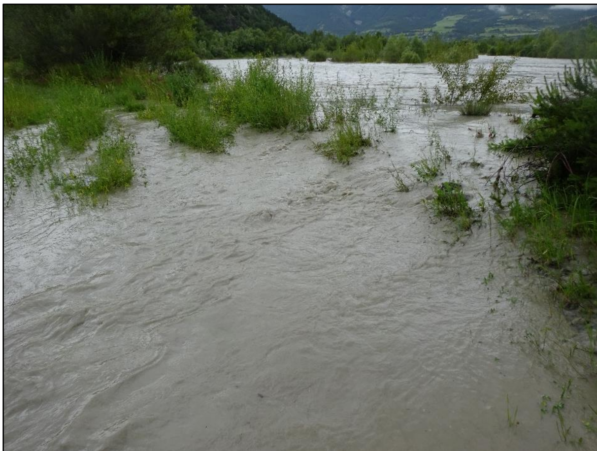
Sur la piste au bord de la rivière.