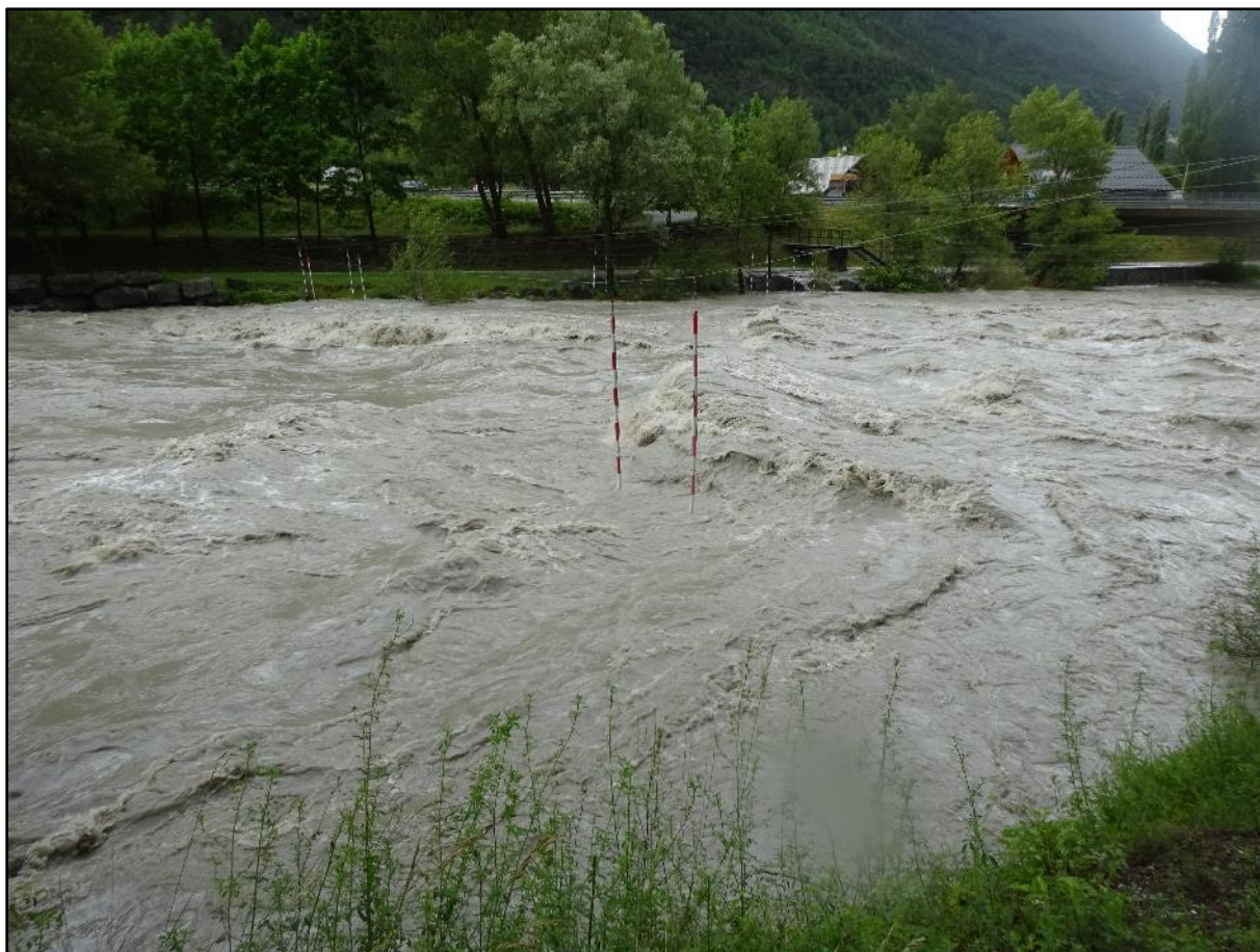
Le stade de slalom et les vagues.