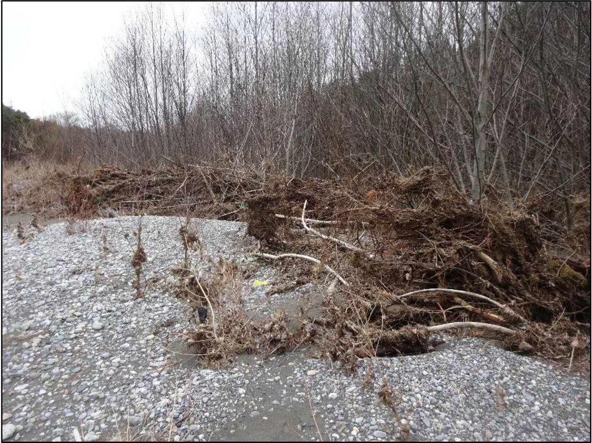
Aux embâcles à base de bois.