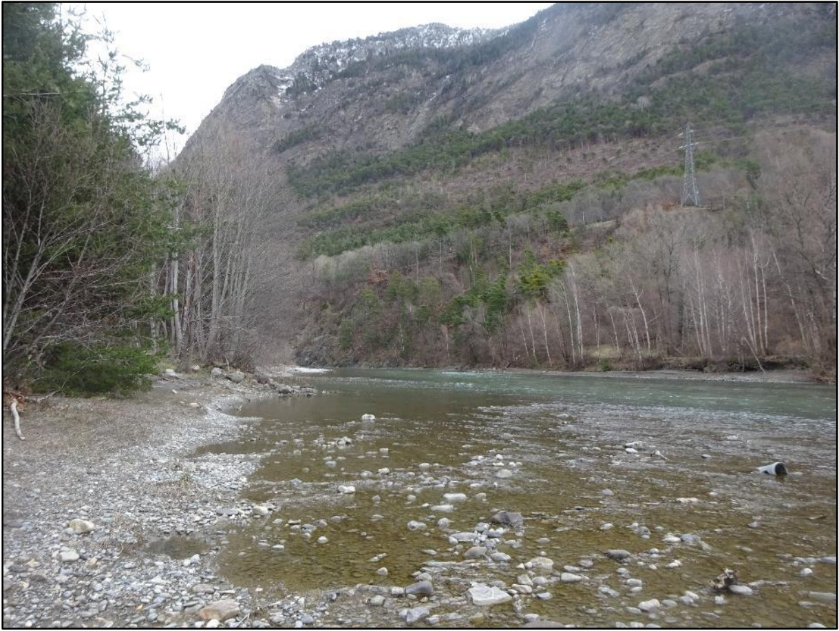
Dans le lit de la rivière, avec vue sur la crête de Penon.