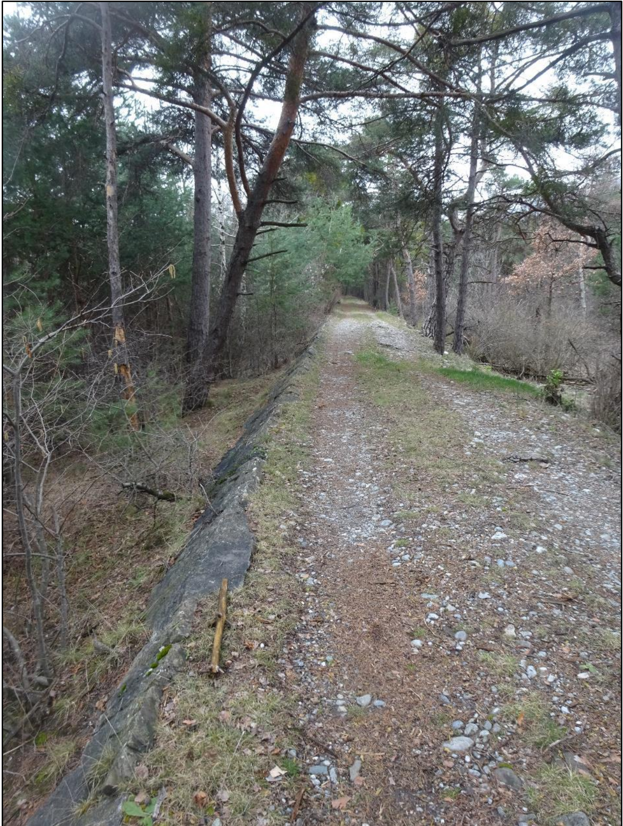
Dernière ligne droite de la digue.