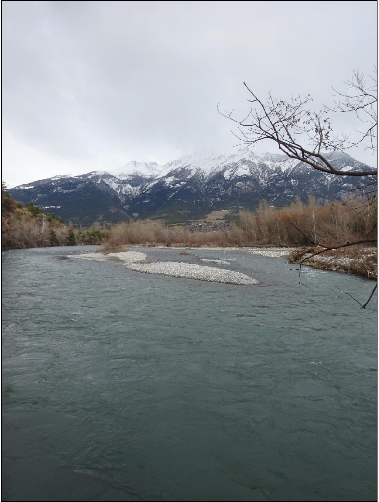
Le bras principal de la Durance vu d'un épi.