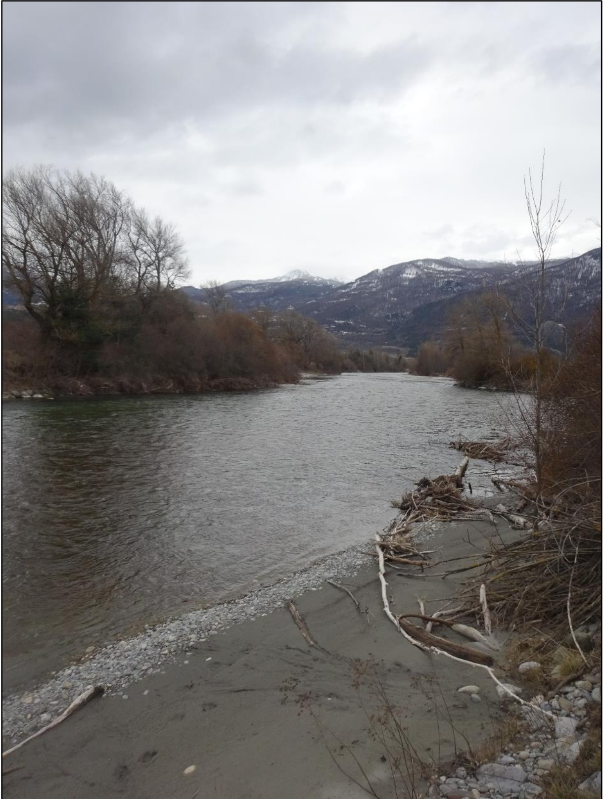
Saint-Crépin puis Eygliers à gauche, Réotier à droite, la rivière entre eux.