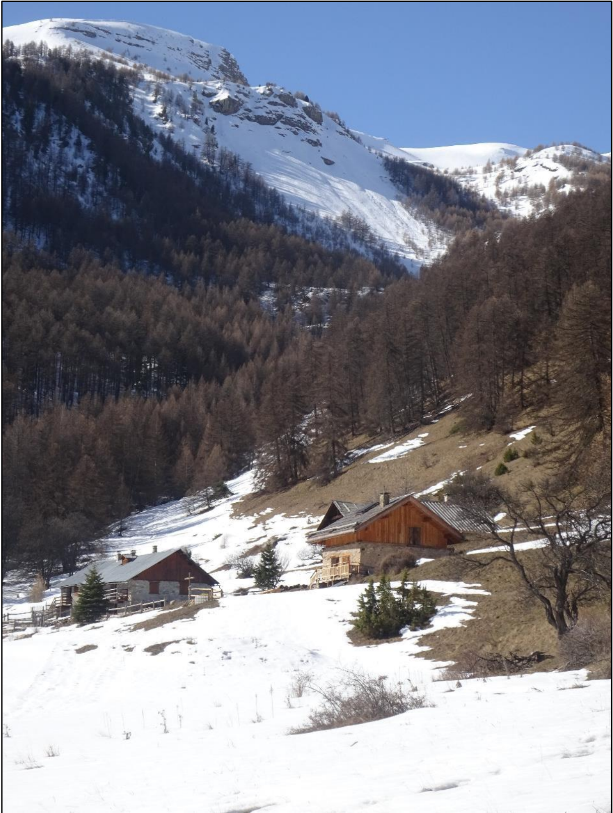
Le vallon et les chalets.