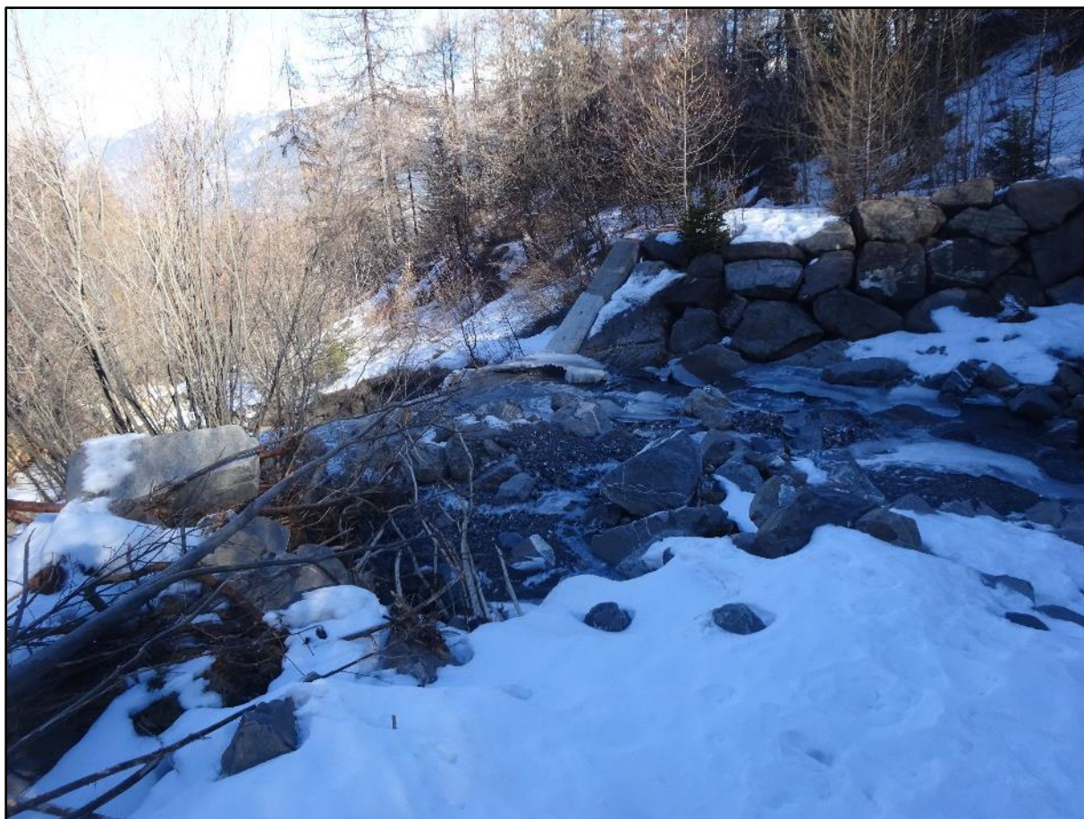
Seuil renforcé par un enrochement en rive droite.