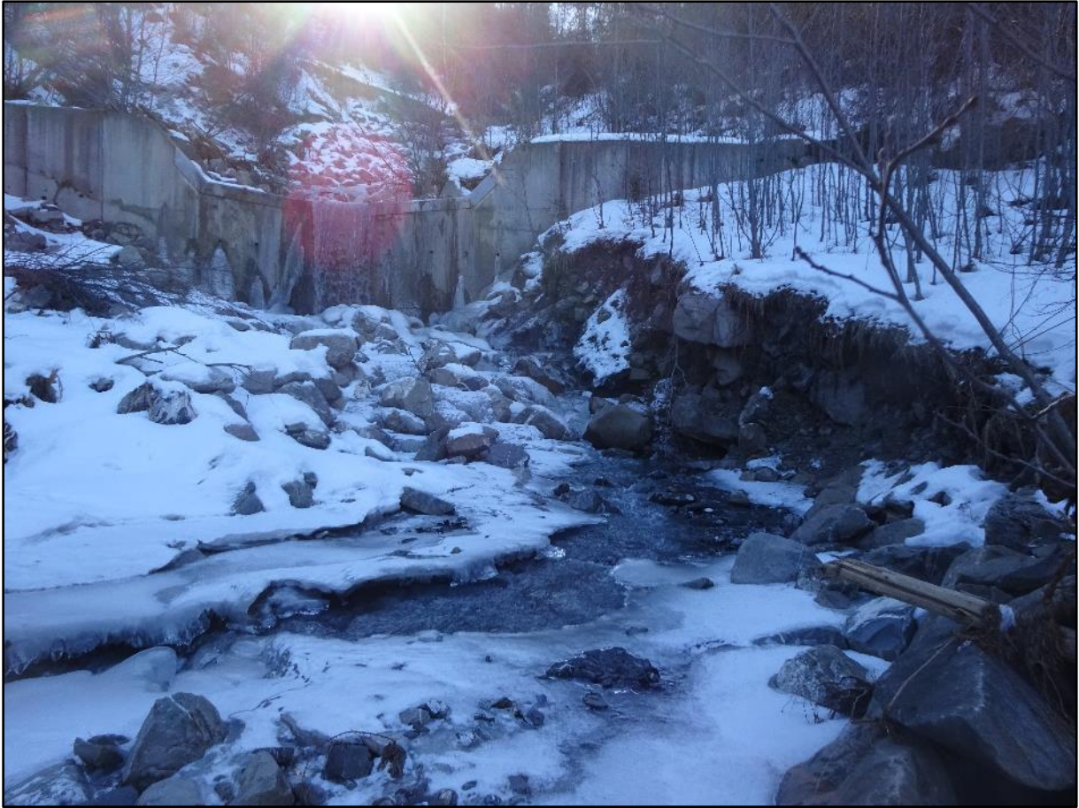
Dépôts de pierres sur la gauche, arrachement de la rive sur la droite.