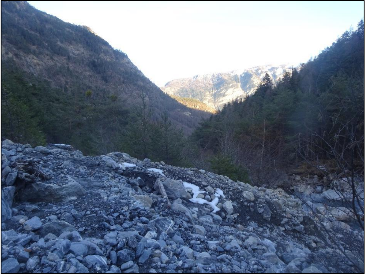
Vue vers l'aval, à droite le Couleau. Au fond, la crête de Martinat sur la montagne de Risoul.