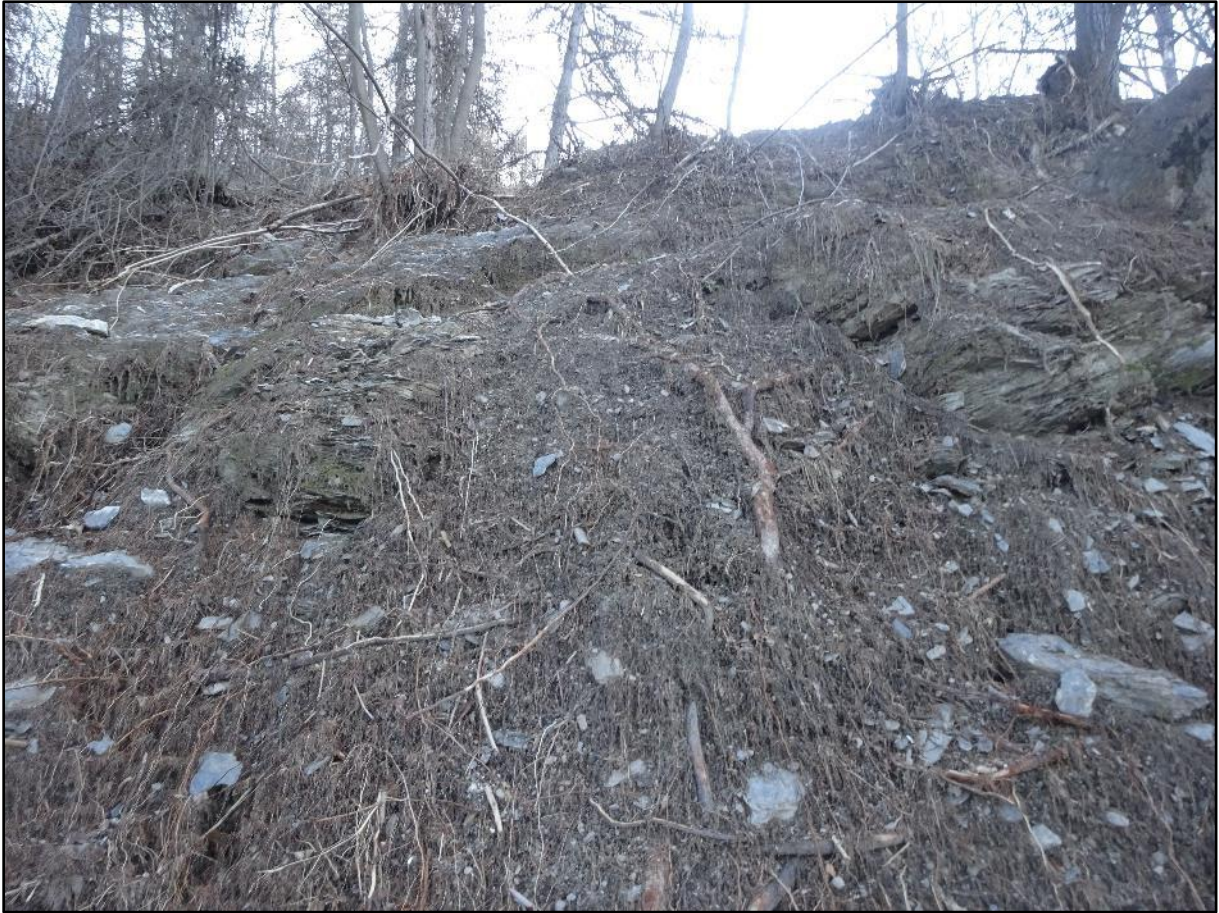
Vue face à la montagne.