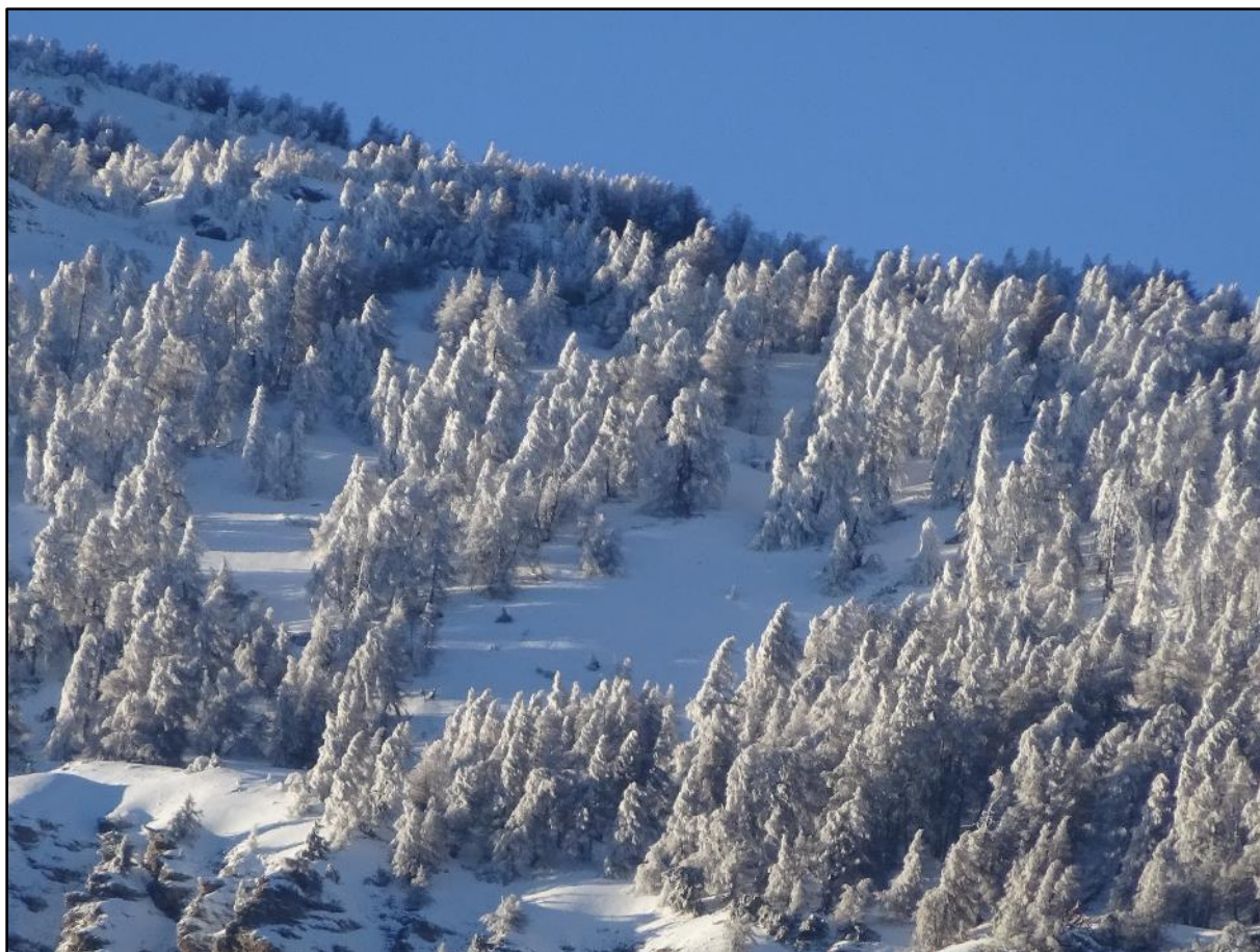
Là-haut, à plus de 2000 m d'altitude, sur Fouran.