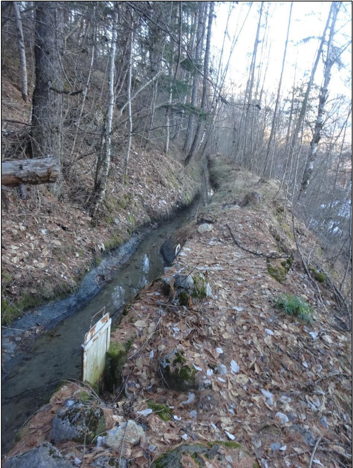
Suite du canal à travers bois.