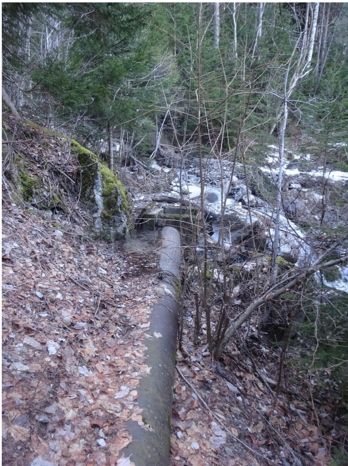
Arrivée à un torrent plus important.