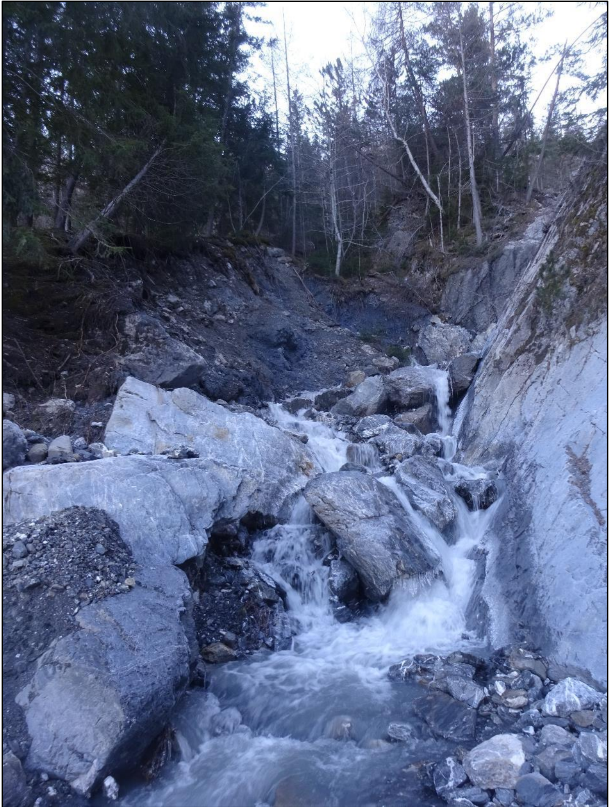
Terre effondrée et gros blocs de rochers.