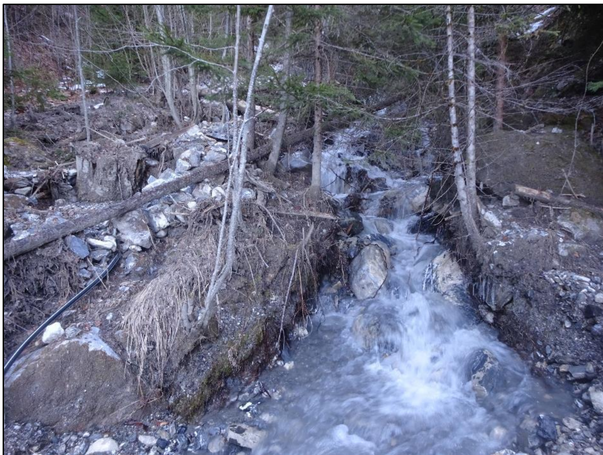
Vue vers l'amont. Traces de passage de crue.