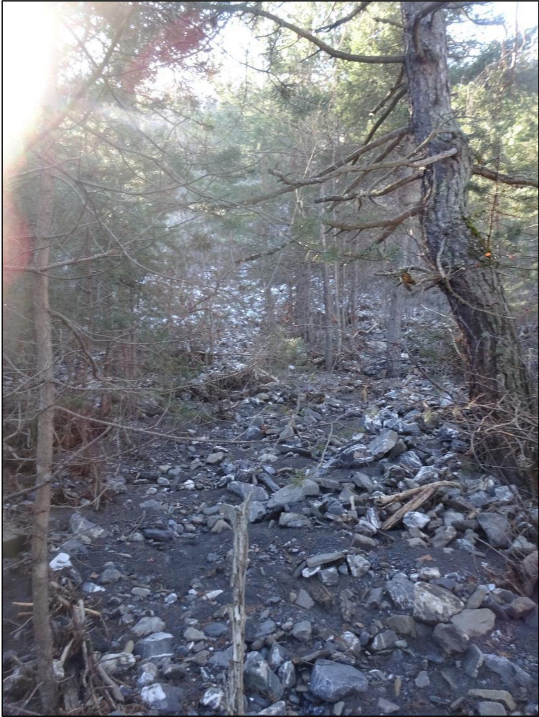
Un des trois passages de l'eau du Mélézet.