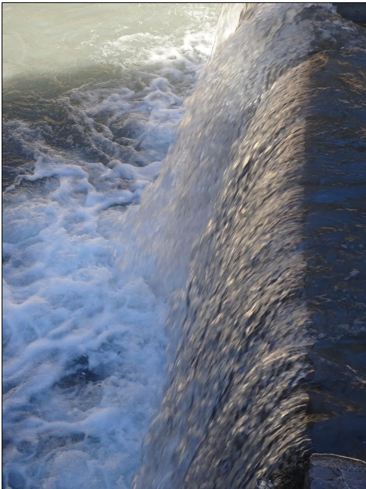
Le même seuil avec la beauté de l'eau.