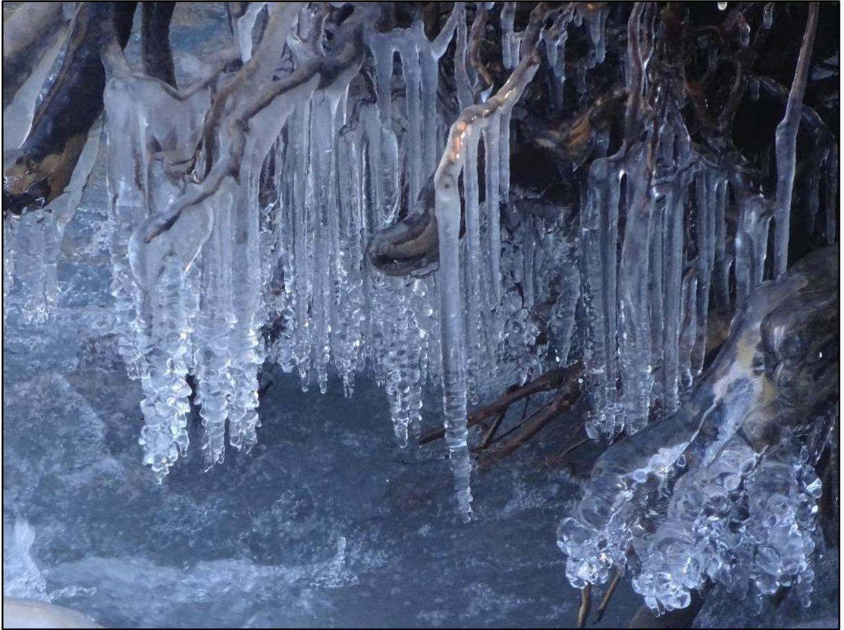
Diverses formes d'eau gelée.