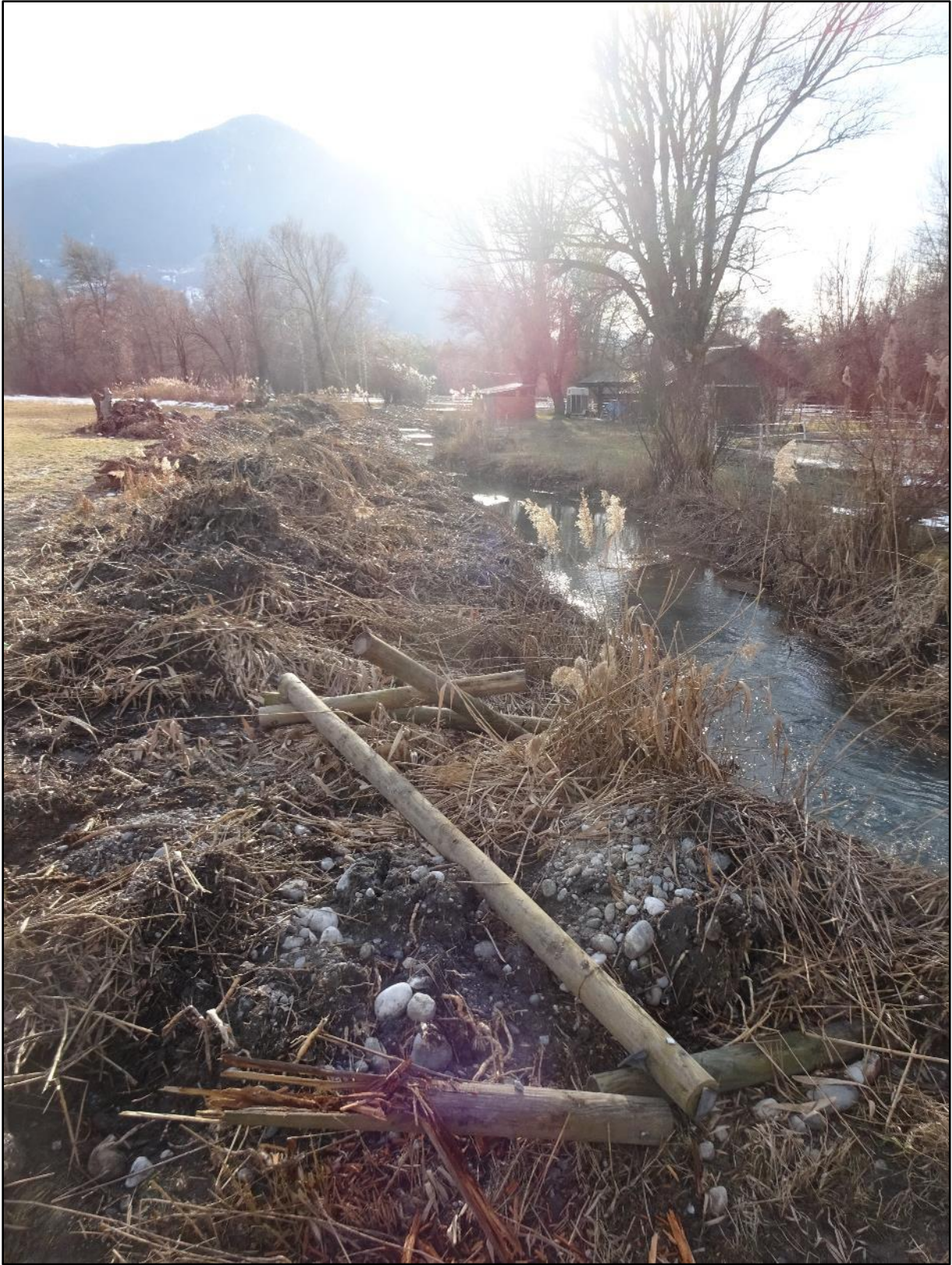
La rase entièrement curée poursuit sa route derrière le centre d'équitation.