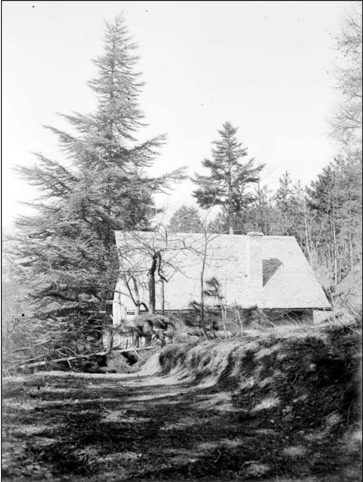
Capture d'écran du site archives.hautes-alpes.fr , onglet iconothèque.