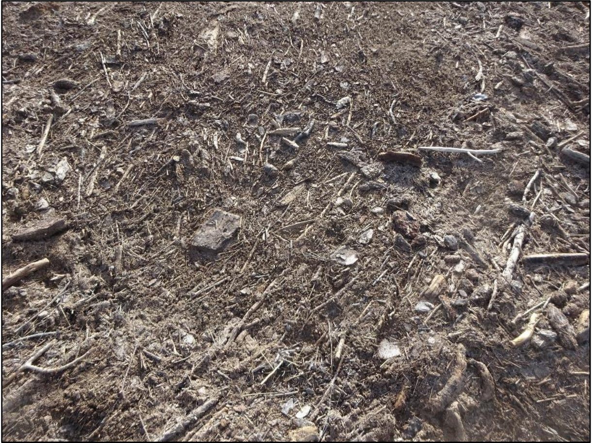
Zone d'accumulation de brindilles et de bâtonnets dans la boue.