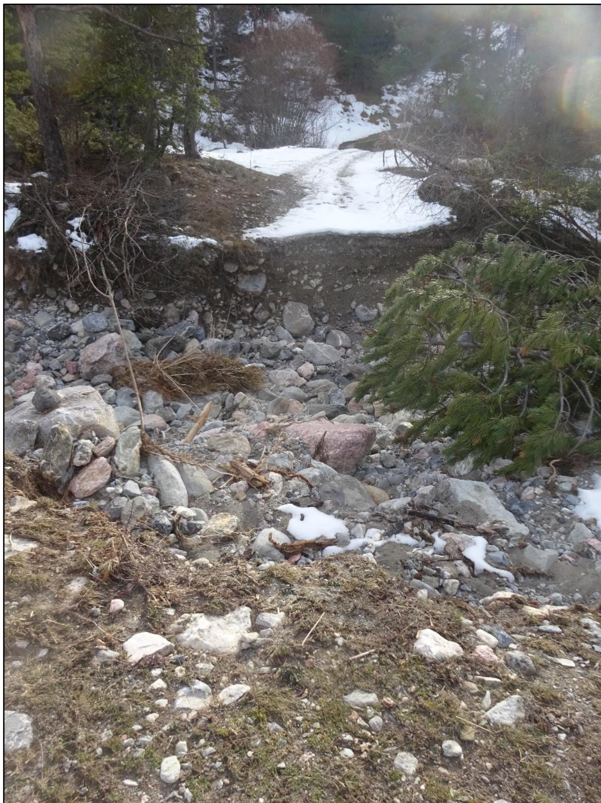
Autre chemin rendu inutilisable.