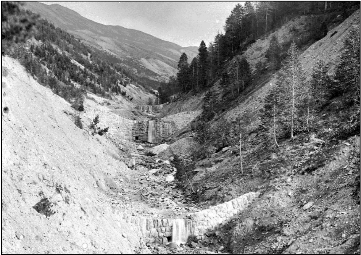
Image 11 : « Barrages 10/4, 11/2 et 11/3- Décapage des berges, boues glaciaires » (1902)

Petit zoom. Une vue en perspective sur plusieurs barrages et le haut vallon du Chagnon.