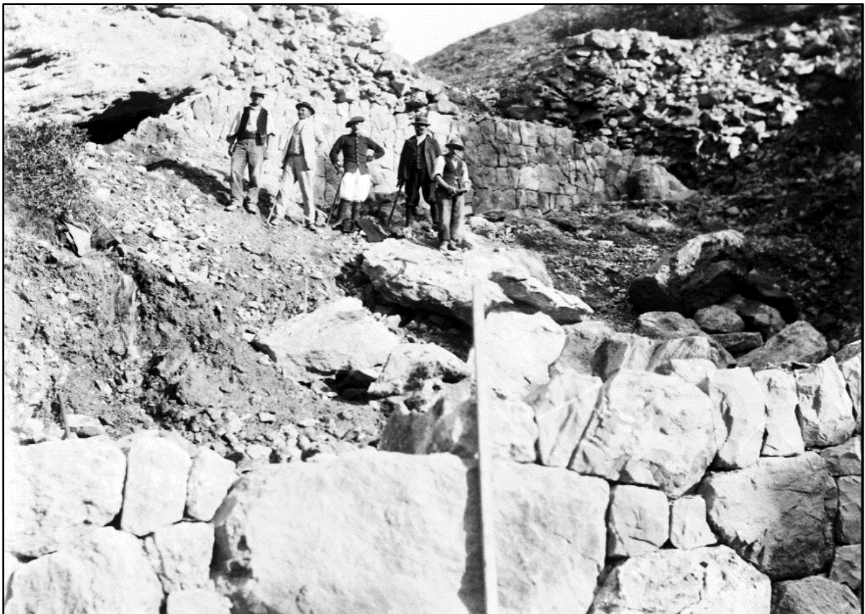
Image 1 : « barrages emportés n°3 et 3 bis en construction », 1901

Capture d'écran du site archives.hautes-alpes.fr , onglet iconothèque, comme les suivantes.