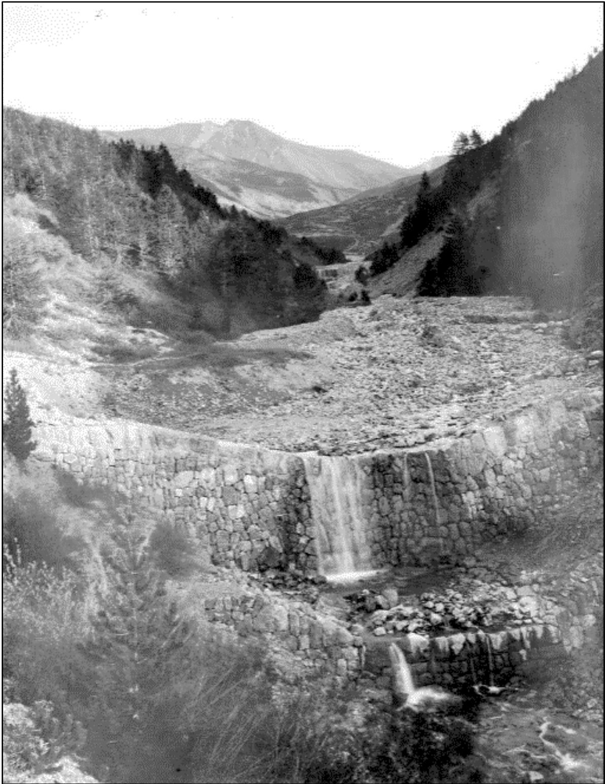
Image 14 : « Torrent de Chagnon. Barrages 5/2, 6/2, 7/2 et contre-barrage construits en 1901 » (1904)

Barrage et contre barrage, jeune forêt certes, mais aussi des dépôts de pierres qui sont arrêtés. Zoom sur le fond de l'image.