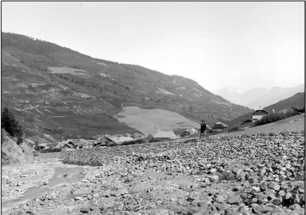
Image 21 : « Digue dans la partie inférieure du Chagnon et hameau de Sainte-Marie (1904) »

Se prémunir des crues du Chagnon ne signifie pas seulement construire des seuils dans son talweg. C'est aussi préserver directement le village concerné par la construction d'une longue digue de protection à la sortie des gorges.