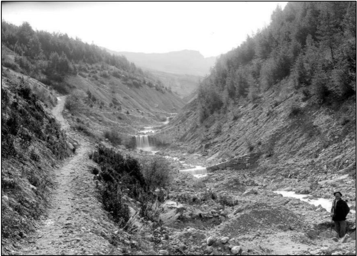
Image 18 : « Barrage n°29 et contre barrage n°29/2, zone inférieure du Chagnon (1904) »

Succession de seuils dans une zone aux versants sujets à l'érosion, et sentier d'accès montrant que les déplacements se font essentiellement à pied.