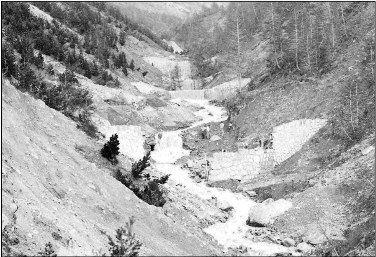
Image 5 : « Barrages n°10/2, 10/3, 10/4 et 11/2 emportés en 1901 en reconstruction (1902) »

C'est un zoom, on ne voit pas qu'il reste de la neige plus haut sur les pentes de la montagne. A gauche, plantation de résineux. Les barrages du premier plan sont détruits, les autres font à nouveau leur office.