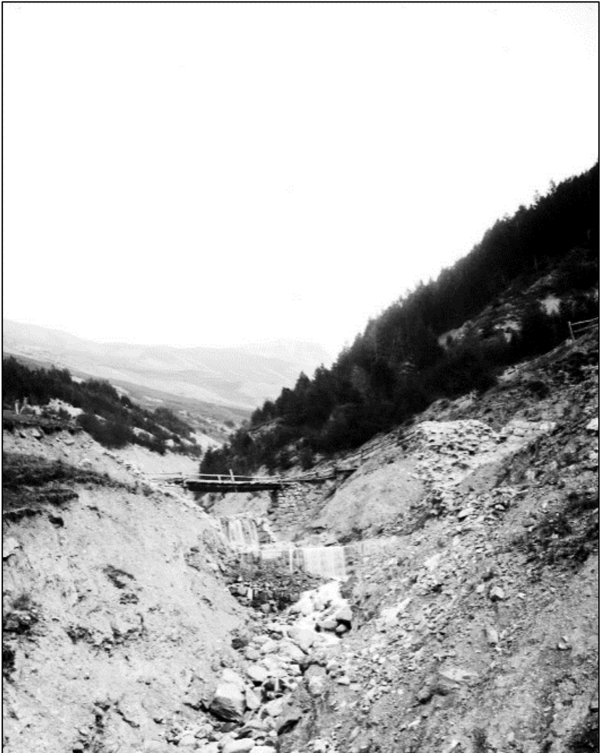
Image 12 : Torrent de Chagnon. Pont barrage n°24, barrage 25/2 et contre barrage » (1904)

Retour au pont de la Salce deux ans après, avec un contexte tourmenté et un intérêt qui provient du massif maçonné sur la droite. Zoom.