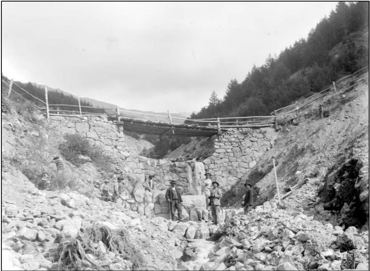
Image 6 : « Ancien barrage n°24 (pont-barrage) et n°24 en construction, appelé aujourd'hui ancien pont de la Salce (1902) »

Le pont de la Salce entre le village de Sainte-Catherine et les alpages du Vallon, par où passaient les bestiaux. Une brouette en bois. Neuf personnages sont au travail, dont un tout à droite est à l'écart.