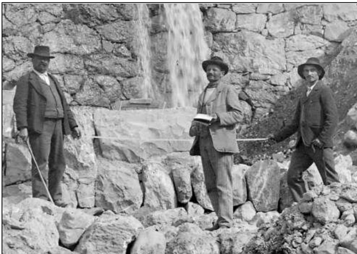
Les maîtres, leurs vestes, leurs cannes et le calepin.