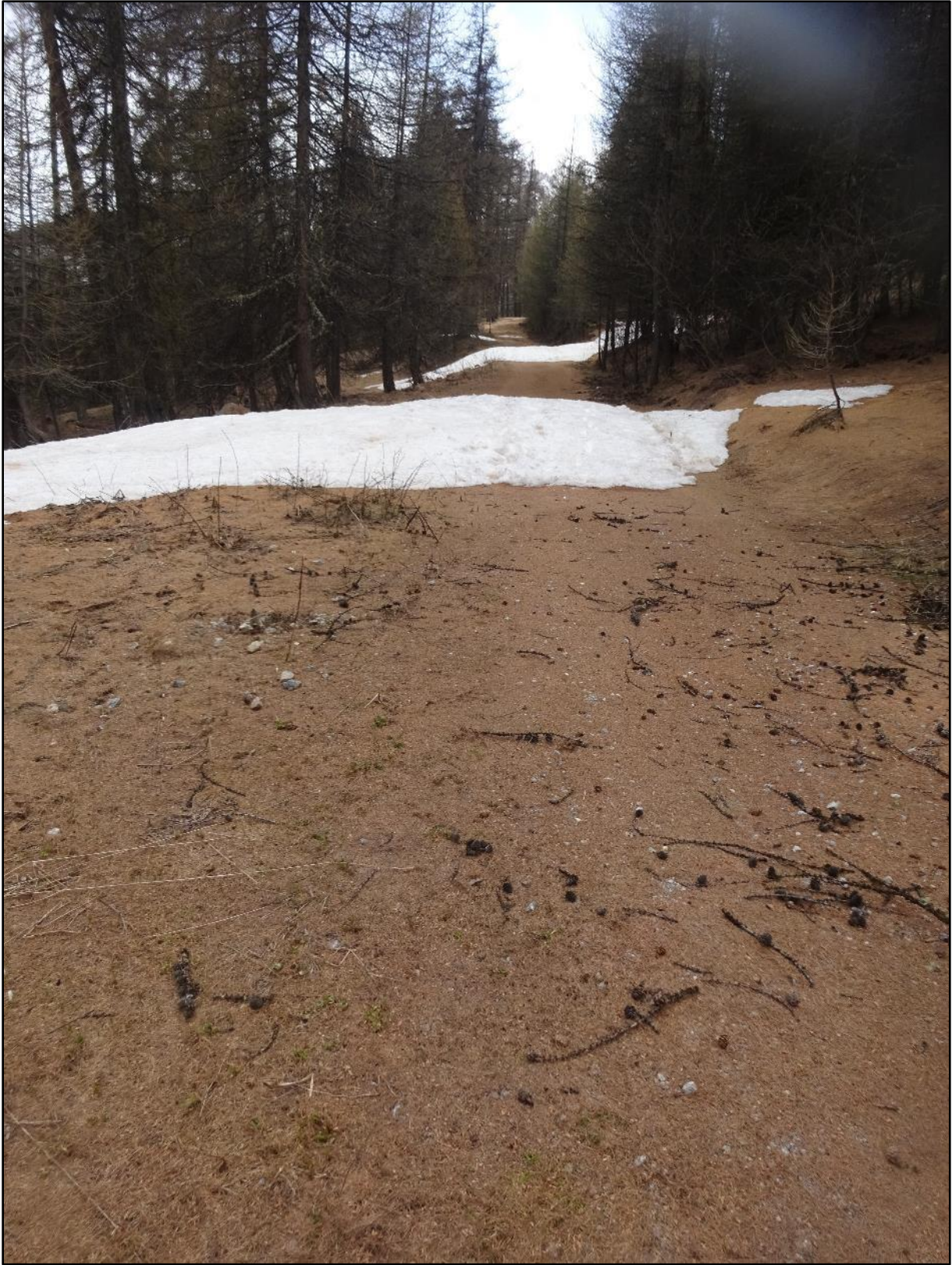
Au Valliret, c'est-à-dire au départ de la piste du Vallon depuis celle de l'Alp.