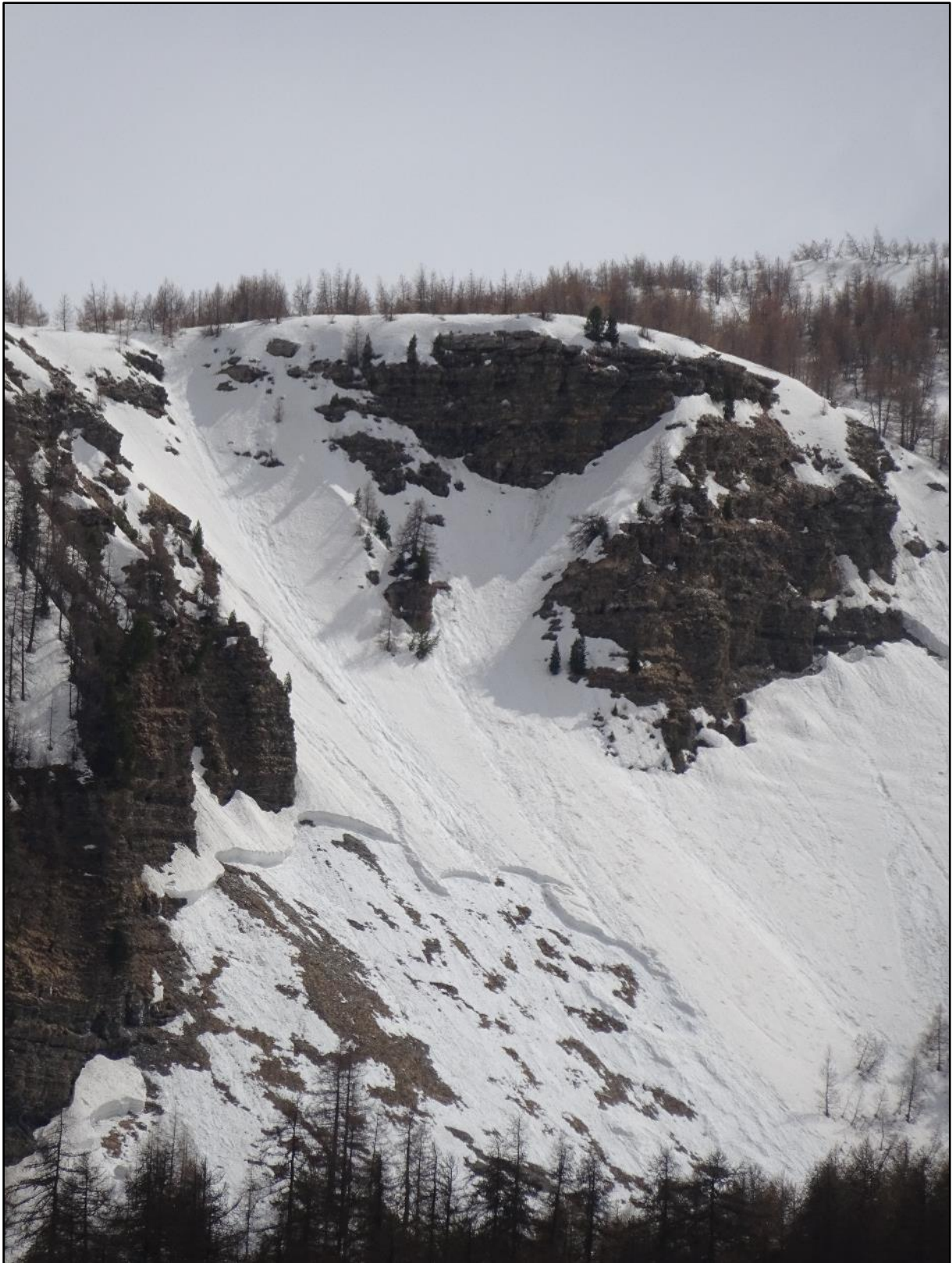
Changement de saison.