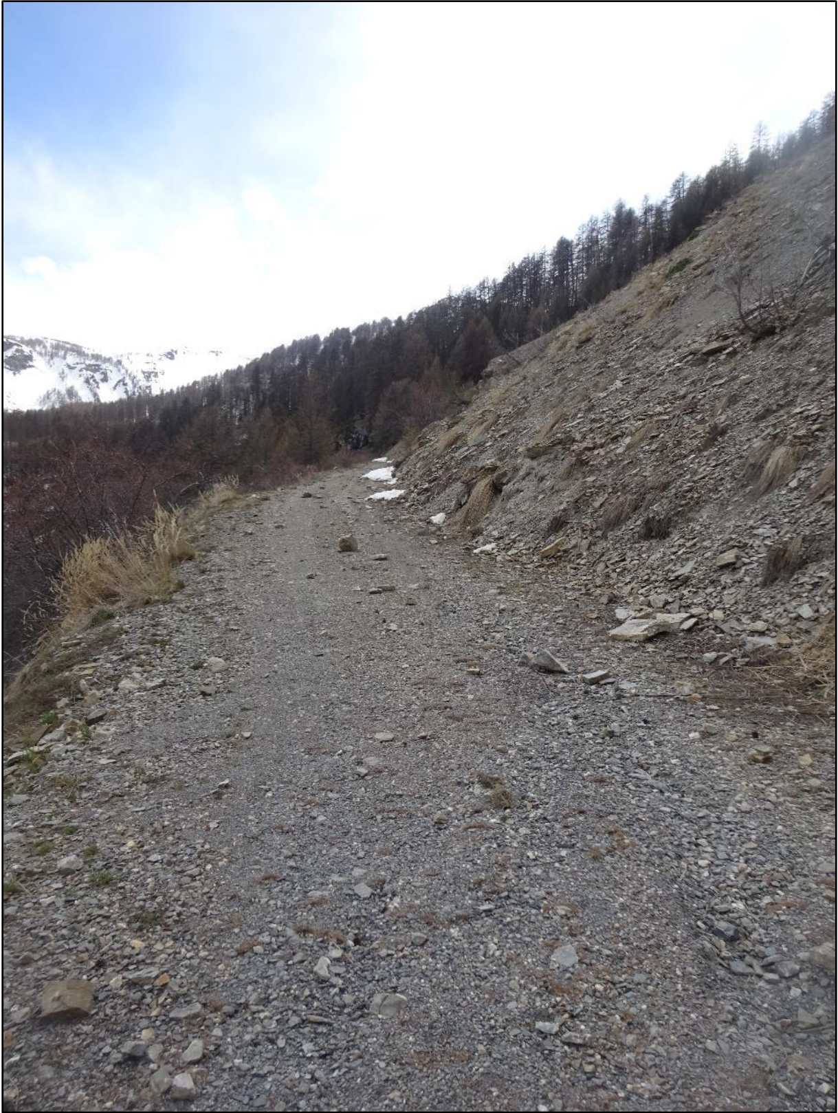
La piste a bien passé l'hiver.