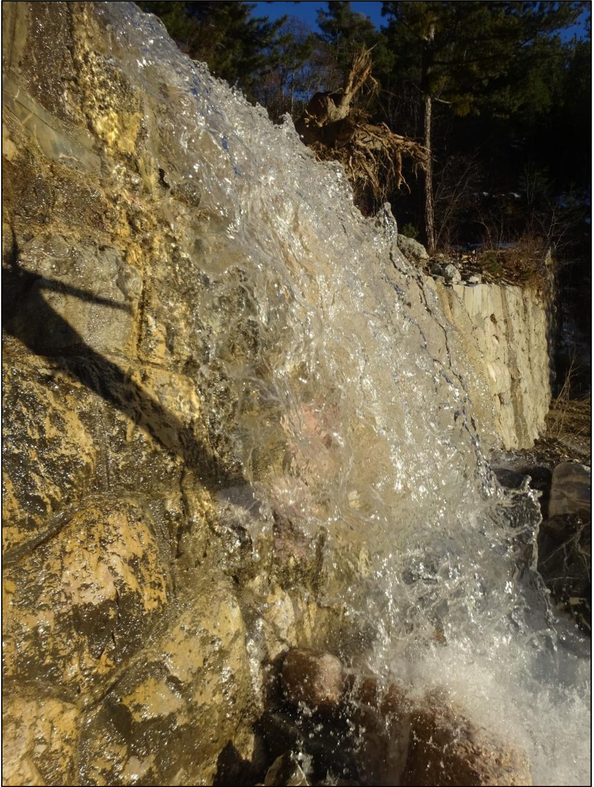
L'eau pure qui saute un seuil au soleil.