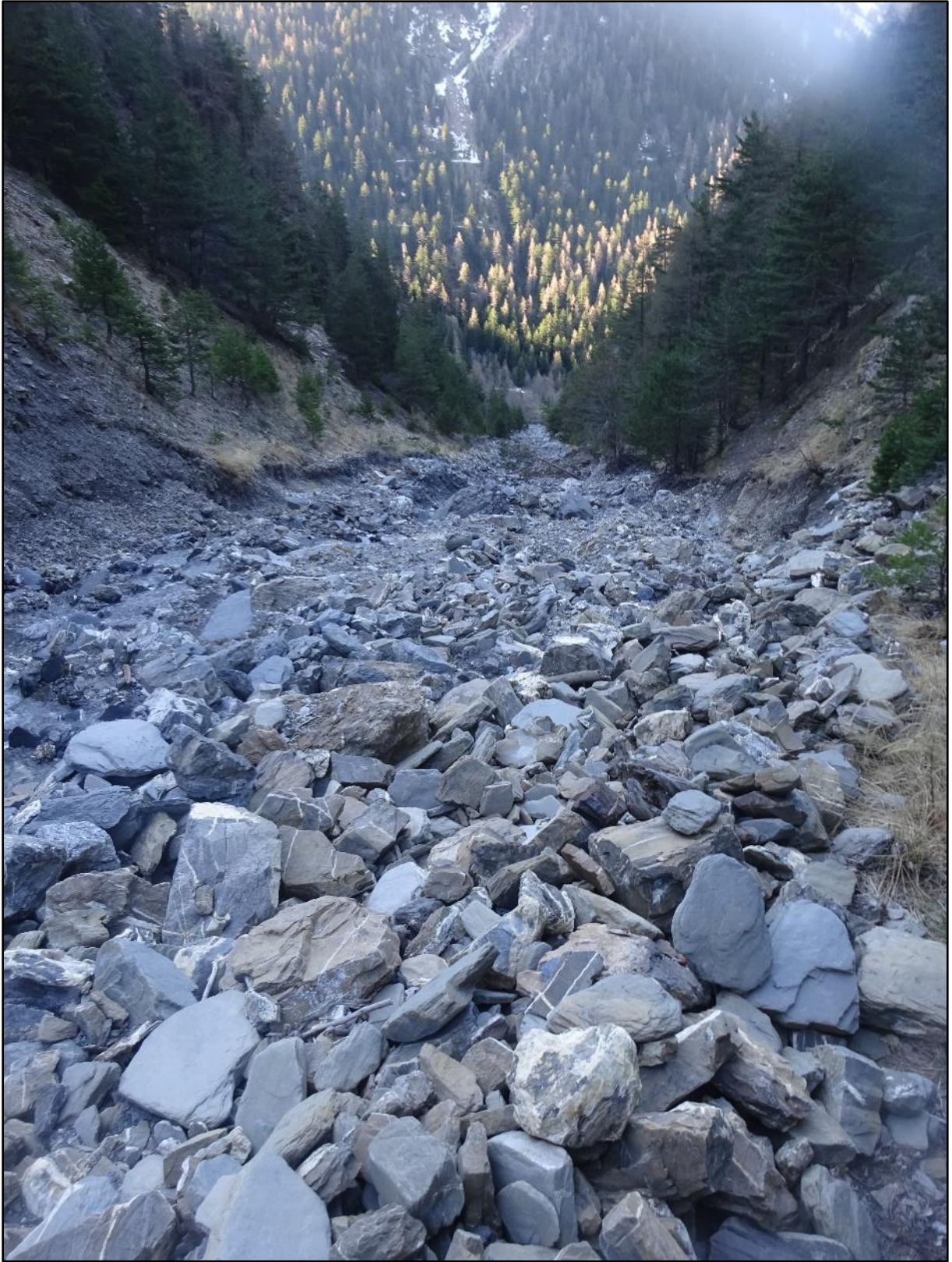
Vue vers l'aval. Pour ceux qui aiment pierres et cailloux.