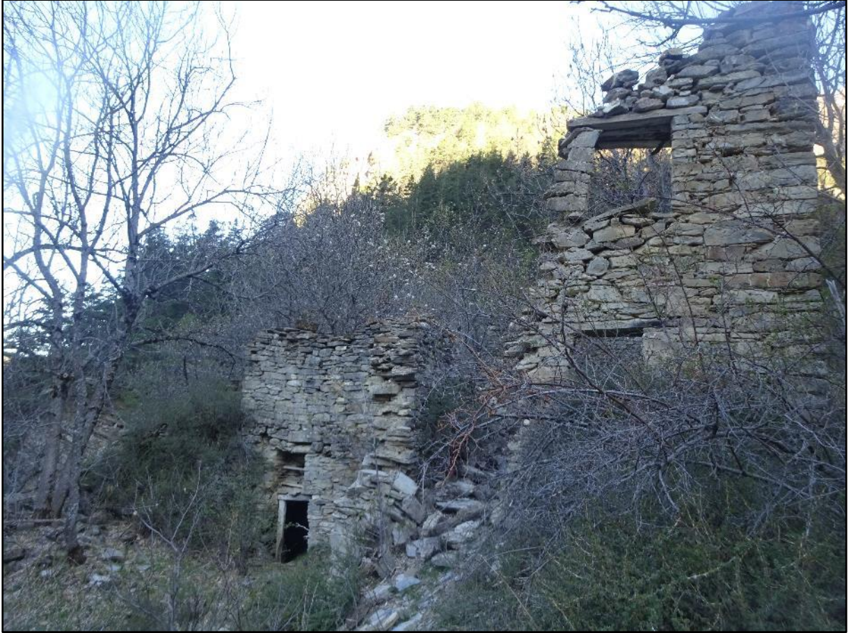
Autres maisons des Florins, ou plutôt ce qu'il en reste.