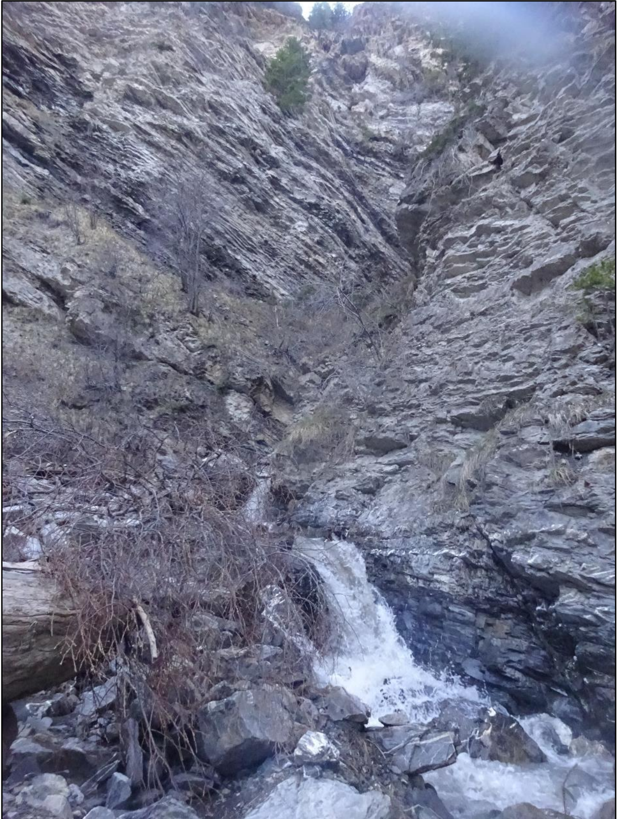
La cascade se cache dans un repli de la falaise.