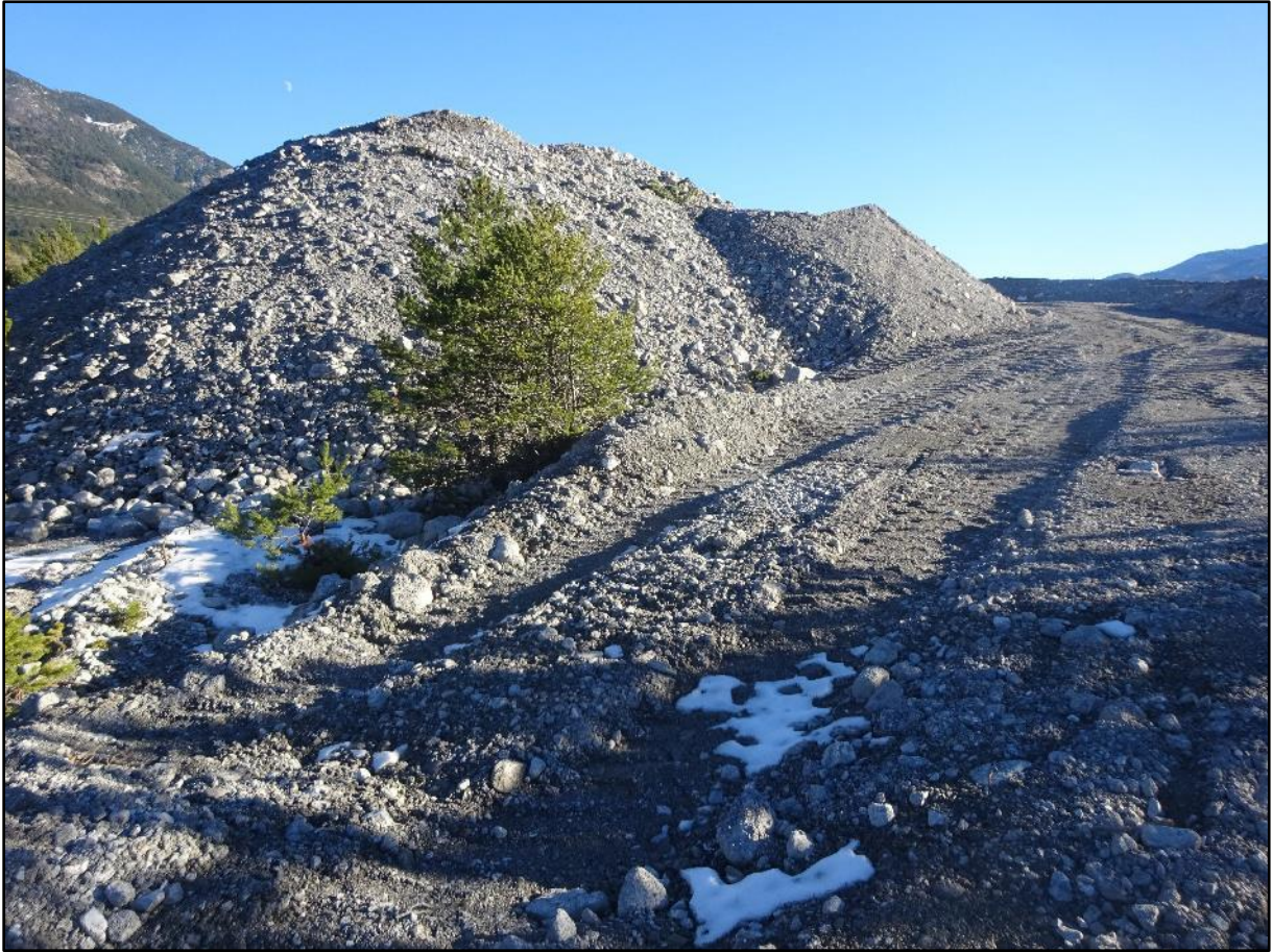
Tas de gravier en rive droite du torrent après nettoyage sous le pont.