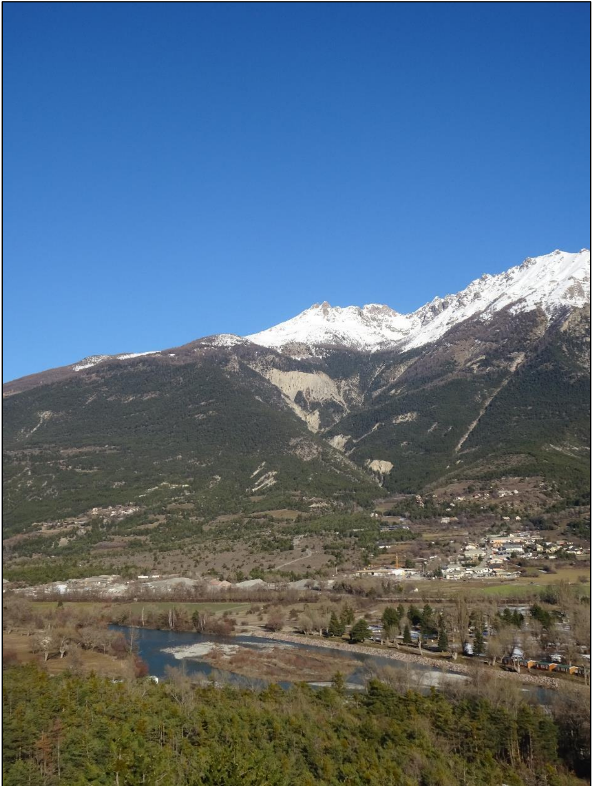
Beauté de l'hiver haut-alpin.