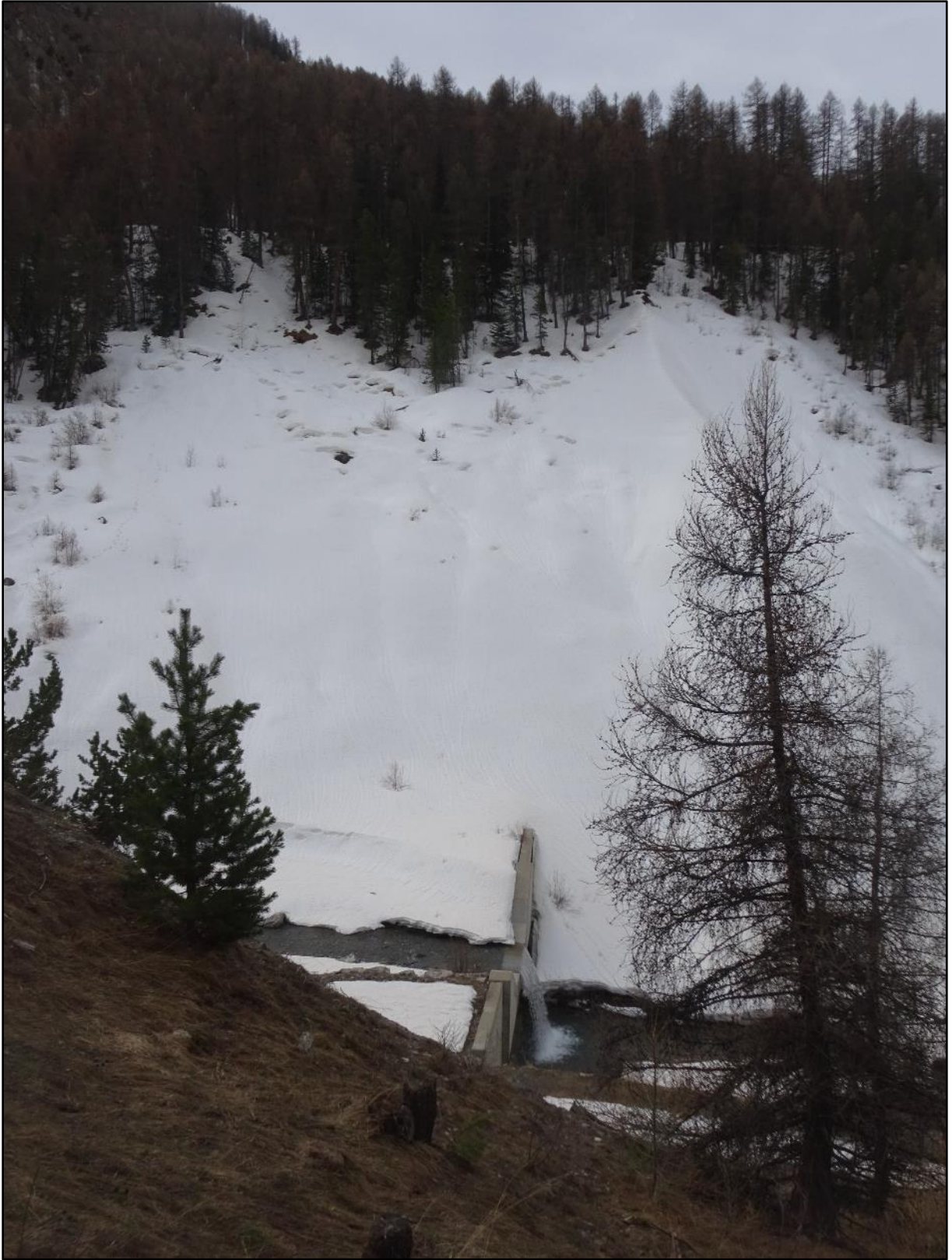
Une vue typique du vallon.