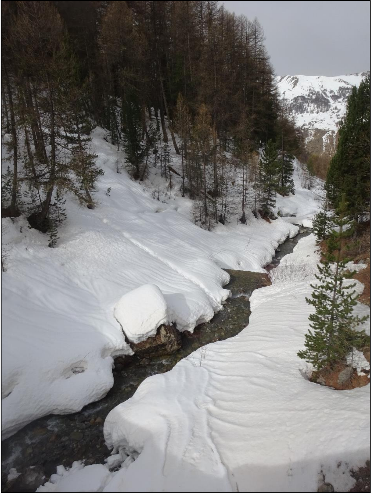
Paysage d'hiver avec un seuil au milieu.