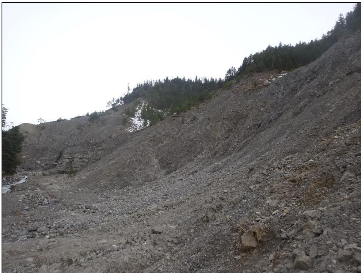
Vue générale du ravinement dans la zone d'érosion juste au-dessus du captage.