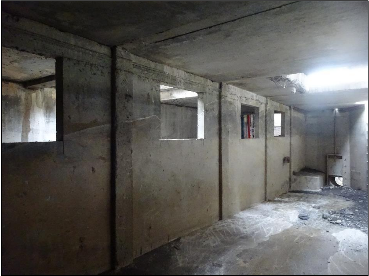
Les deux chambres d'eau.