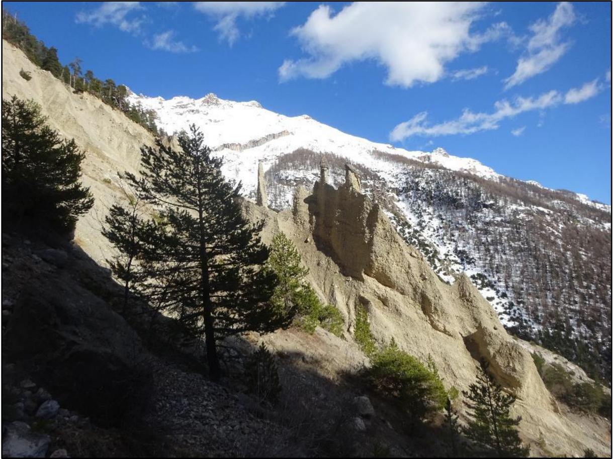
Les demoiselles se détachant sur un fond enneigé.