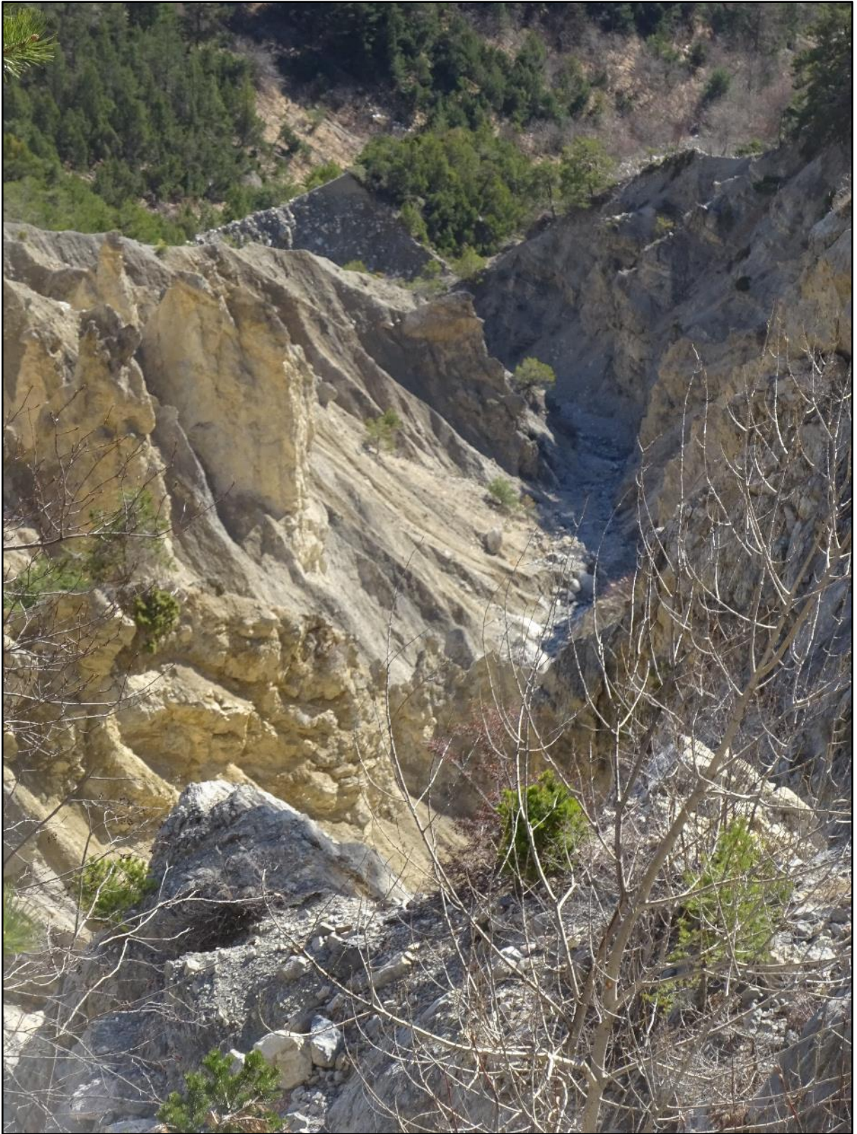
Une zone particulièrement sujette à l'érosion.