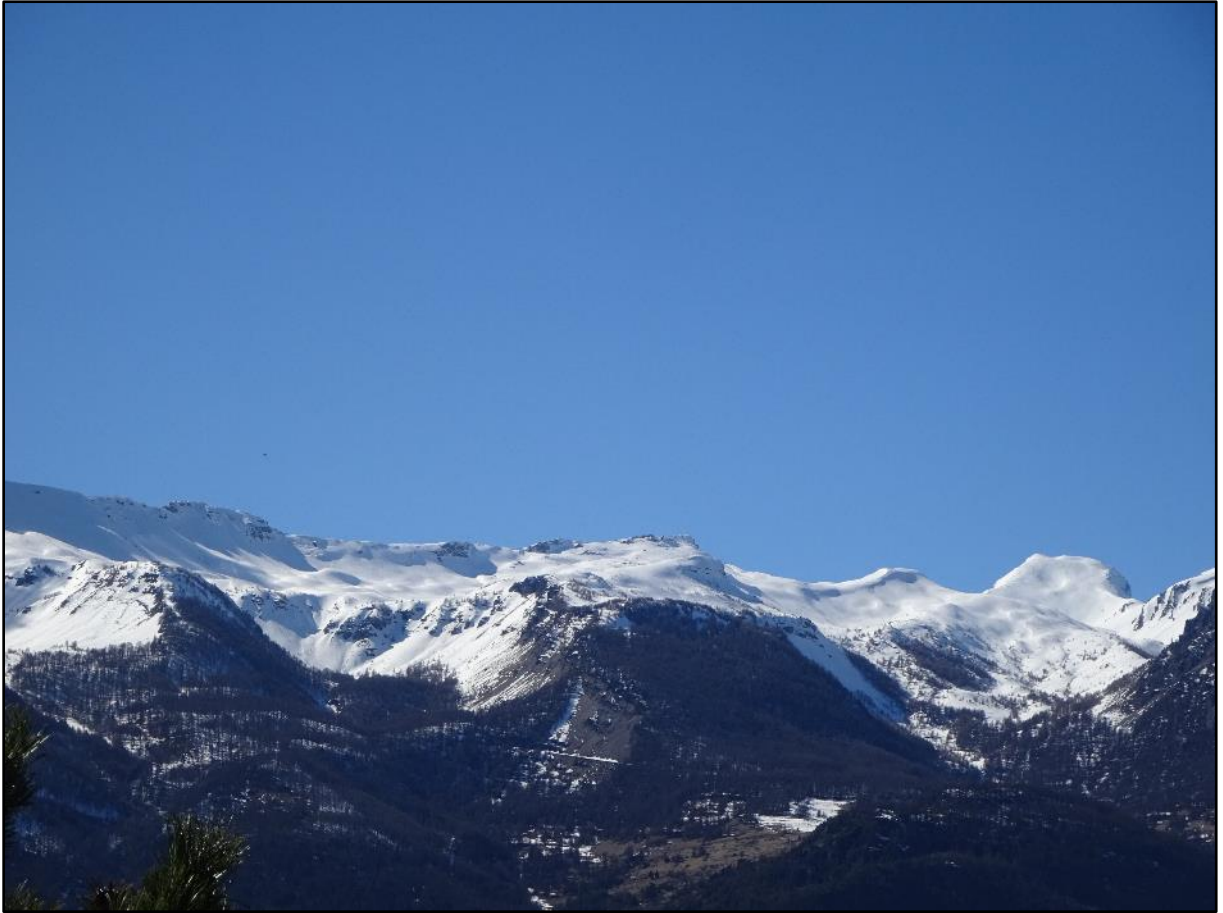
Vue sur la belle montagne de Réotier.