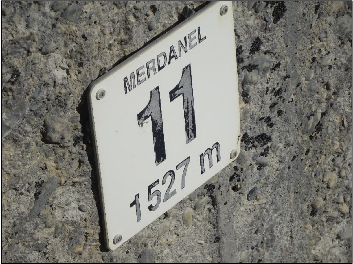
Image 27 la plaque du seuil

Fixée sur la paroi en béton, tout est dit. Pour rappel, les dix premiers ouvrages sont au niveau des plus hauts anciens champs sous la première série de demoiselles.