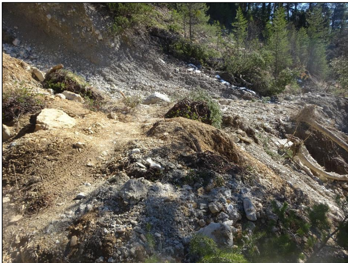
Autre vue du même endroit.