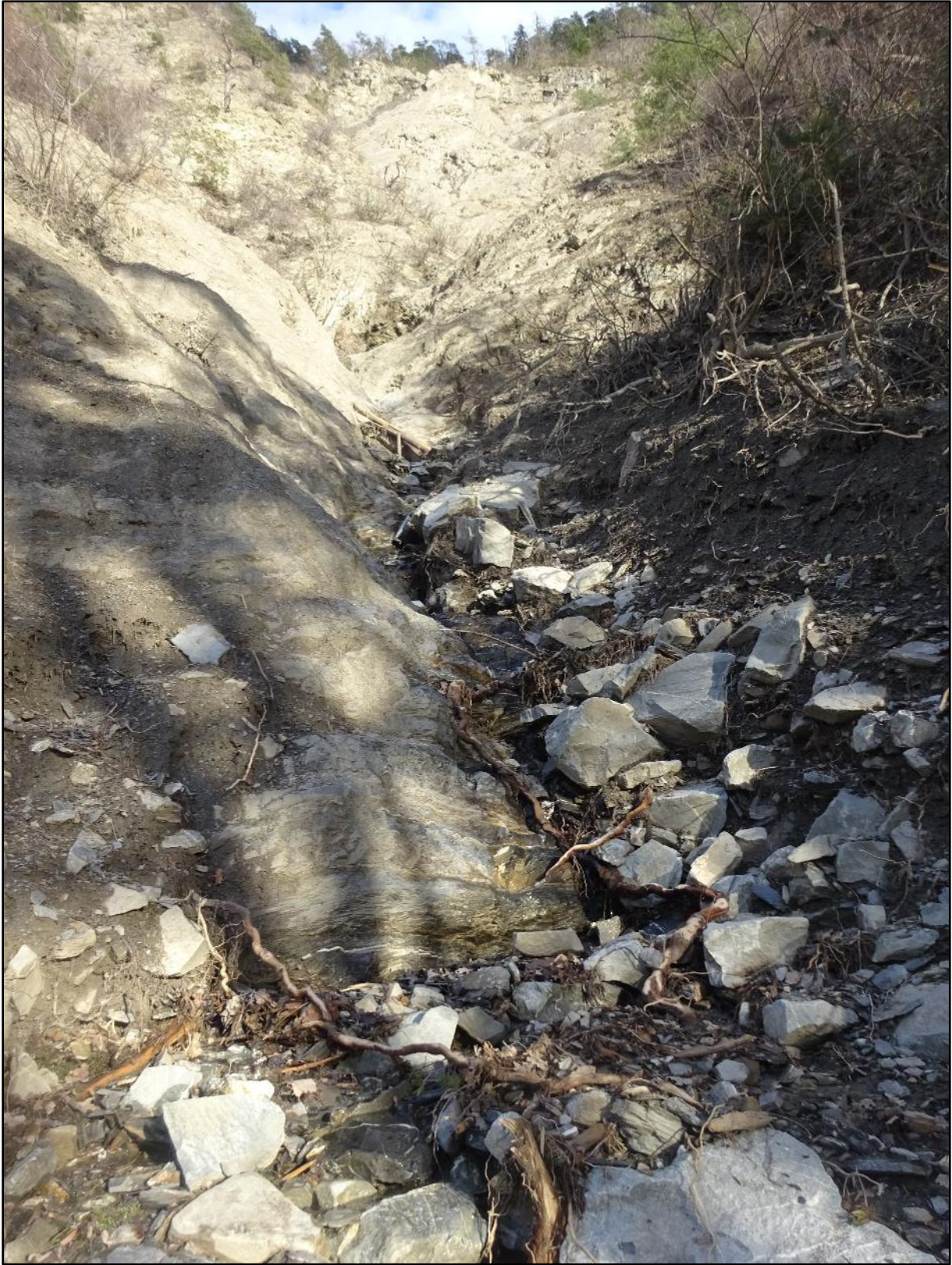
Approche d'une zone particulièrement en pente.