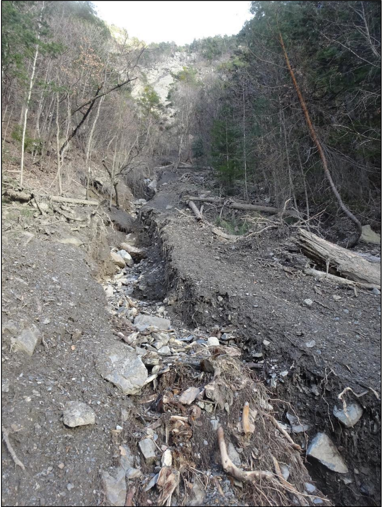
Ravine importante avec des côtés bien dégagés malgré le bois jonchant le sol.