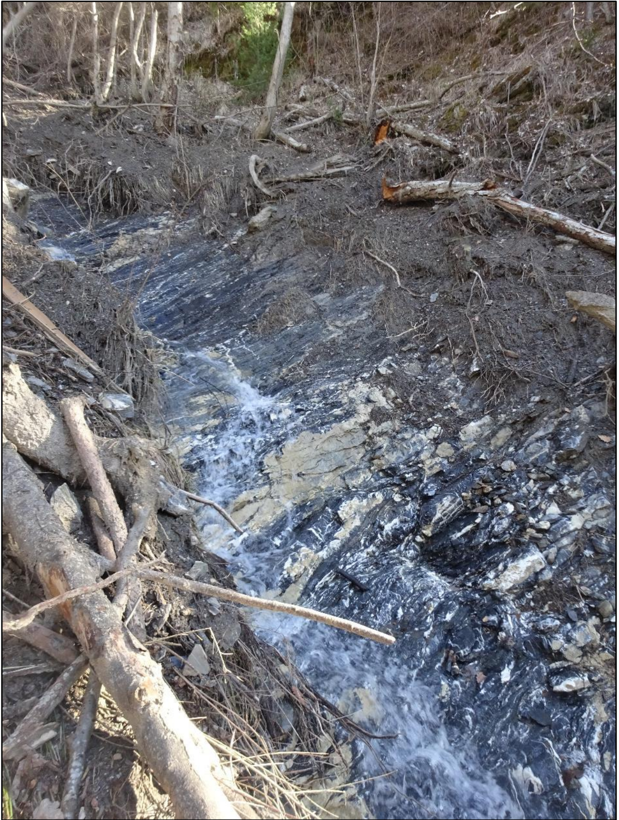
La roche-mère mise à nu et curée.