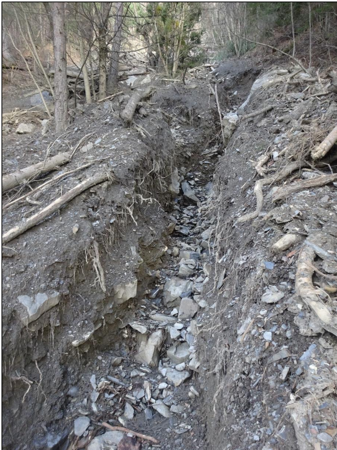
Passage bien raviné dans la grande ravine de la combe du Pibou.