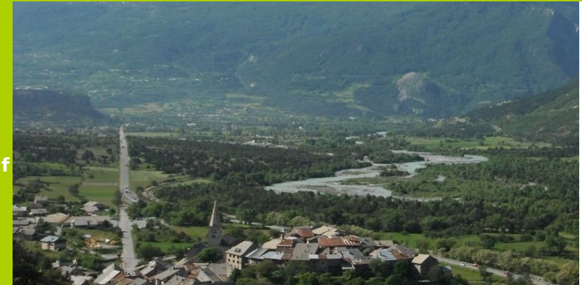
Village en escargot de Saint-Crépin

Cet itinéraire est aménagé en sentier d'interprétation. Des panneaux illustrés vous permettront de découvrir l'un des plus importants peuplements de Genévriers Thurifères d'Europe, une forêt unique, et des arbres très originaux. Une fois votre balade terminée, la visite du village de Saint-Crépin au patrimoine architectural et vernaculaire si riche mérite de prendre un moment.